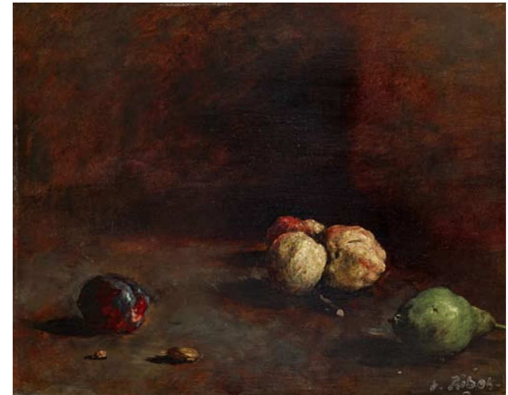
STILLEBEN MIT FRÜCHTEN

Öl / Holz, 32 x 41 cm, u. re. Sign.-Stempel PROV.: DELBANCO, BROWSE & DARBY, LONDON