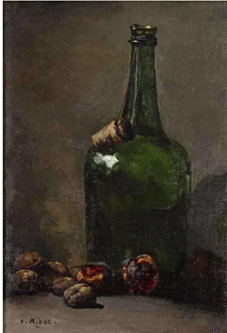
STILLEBEN MIT WEINFLASCHE UND FRÜCHTEN