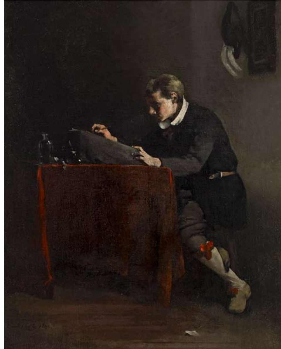
JUNGE AM SCHREIBPULT Öl/ Lwd. 46,5 x 38 cm, u. li. sign, u. dat. 1861 PROV.: PRIVATBESITZ, HAMBURG

AUGUSTIN THÉODULE RIBOT wurde 1823 als einziger Sohn in Saint-Nicolas-d'Attez/Eure geboren. Als sein Vater starb, musste RIBOT bereits im Alter von 17 Jahre die Verantwortung für seine Mutter und seine Schwestern übernehmen. Obwohl er bereits als Kind Interesse an der Malerei zeigte, betätigte er sich zunächst als Buchhalter in einer Tuchwarenhandlung.